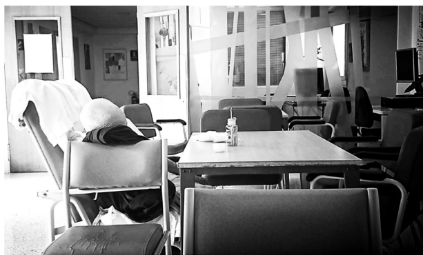
Figura 2 Soledad.

hará más sabios y mejores personas 8 . El llamado movimiento de la ómica a la humanómica 9,10 .